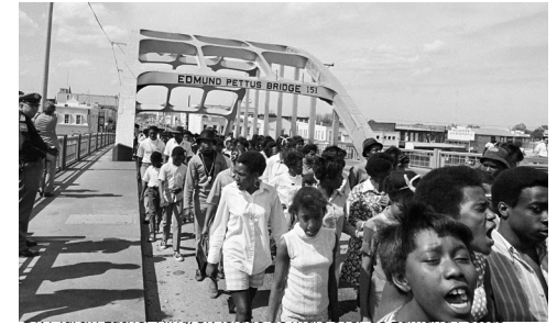
Bridge in Selma op 21 maart 1965.

De prachtige wandeling van 5 km over de Binnenweg en Oudekerkdijk langs de Amstel is een perfect moment om een podcast te beluisteren of een van de toespraken van Martin Luther King, te vinden op Videos & Podcasts. Je loopt langs molen de Zwaan, gebouwd in 1638. Rond 1700 waren er 44 buitenplaatsen langs de Amstel. Daar zijn er 3 van over: Oostermeer, Wester-Amstel en Amstelrust. Ga onder de Utrechtsebrug door en neem rechts de trap omhoog om op de Utrechtsbrug te komen.