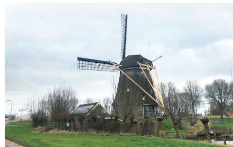
Molen de Zwaan (1638)

Anton de Kom is een held in Suriname. Hij was een antikoloniaal schrijver en schreef Wij slaven van Suriname (1934, nieuwe uitgave en bestseller in 2020). Hij was verzetsstrijder in Nederland tijdens WOII en is gestorven in een concentratiekamp. Een standbeeld om hem te eren staat op het Anton de Komplein. In 2020 werd hij opgenomen in de canon van de Nederlandse Geschiedenis en krijgt daarmee eindelijk erkenning. Hij woonde op Reestraat 6 (Wandeling Centrum). Bezoek CBK Zuidoost, Anton de Komplein 120, waar je kunst, klein en groot, kan kopen en huren. Het is de enige kunstinstelling waar inclusiviteit in het DNA zit. Een goede pauzeplek, met mooie kunst, thee en wc. Loop zuidwestwaarts via (A) Station Bijlmer ArenA, over de Burgemeester Stramanweg, rechts Weidepad en links Molenpad naar de Amstel.