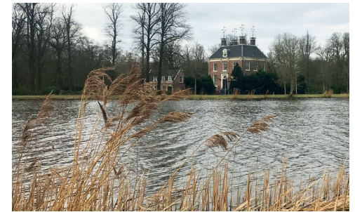
Amstel River, buitenplaats Amstelrust (1724)