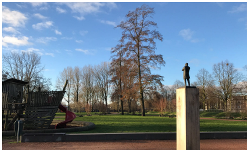
Martin Luther King Park, Amsterdam