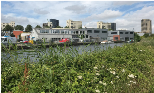
Op de achtergrond de Bijlmerbajes die wordt afgebroken voor woningbouw (zomer 2019)

Het park werd vernoemd naar Martin Luther King, Jr. nadat hij was vermoord op 4 april 1968. Loop noordwaarts langs de Amstel, ga over de Berlagebrug, langs Station Amstel en volg de Weespertrekvaart.