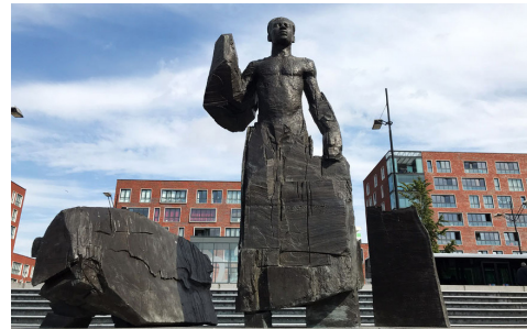
Standbeeld Anton de Kom door Jikke van Loon (2004)