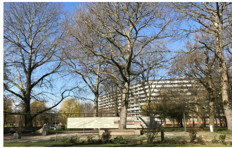
'De boom die alles zag' op 4 oktober 1992.

De Weespertrekvaart is een trekvaart die de Amstel verbindt met de Vecht in Weesp. De trekvaart werd in 1639 aangelegd, gebruikmakend van bestaande waterwegen: de ringvaart van de polder Watergraafsmeer (aangelegd in 1629), de ringvaart van de polder Bijlmermeer (aangelegd in 1626), de riviertjes de Gaasp en het Smal Weesp. Loop zuidoostwaarts door Diemen-Zuid.