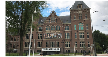
Tropenmuseum, Linnaeusstraat 2

Aan Zeeburgerdijk 19 staat het Hugo Olijveldhuis, waar sinds 1919 Vereniging Ons Suriname is gevestigd. Na de Tweede Wereldoorlog ontwikkelde de VOS zich onder voorzitter Otto Huiswoud tot broedplaats voor de onafhankelijkheid. The Black Archives is een uniek historisch archief van meer dan 3000 boeken. Het archief is op afspraak te bezoeken. Loop via Roomtuintjes en Commelinstraat naar het Tropenmuseum.