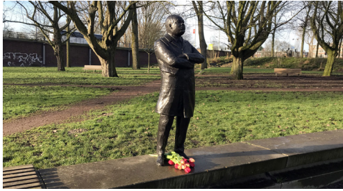
Martin Luther Kingpark, Amsterdam