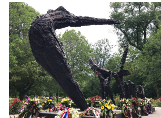
Nationaal Slavernijmonument, Erwin de Vries (2002), in de zuidwesthoek van het Oosterpark

Het Tropenmuseum is in 1864 opgericht om de koloniale bezittingen te tonen. In de 70er jaren van de vorige eeuw werd de focus meer gelegd op sociale issues. Tegenwoordig is er een permanente tentoonstelling Heden van het slavernijverleden en wisselende exposities. Wandel door het Oosterpark naar het Monument voor het Slavernijverleden.