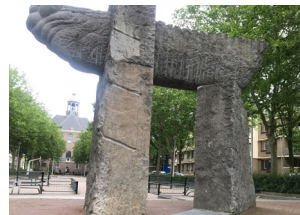
Schip op de Helling, tussen de Kleine en Grote Wittenburgerstraat VOC monument van Marius van Beek, Wim Tap en Hank Beelenkamp (1983)

Oostenburg vormt met Kattenburg en Wittenburg de Oostelijke eilanden, aangelegd in de 17e eeuw tijdens De Grote Stadsuitleg. In 1661 kocht de VOC het eiland waar scheepswerven werden gevestigd en zo'n 500 schepen werden gebouwd waarmee ook slaafgemaakte Afrikanen werden vervoerd. In 1697 liep tsaar Peter de Grote er 4 maanden stage. Tot 1925 werden hier schepen gebouwd. Sinds 2003 zijn de redacties van Het Parool, Volkskrant en Trouw er gevestigd. Loop naar de Poolstraat en steek door richting de Wittenburgerkade.