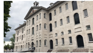
VOC pakhuis 's Lands Zeemagazijn, het Scheepvaartmuseum

Op scheepswerf De Eendracht werd door de WIC (West Indische Compagnie) slavenschip Leusden gebouwd. Dit schip verging op 1 januari 1738 in de monding van de Marowijnerivier in Suriname en 664 slaafgemaakte Afrikanen verdronken in het dichtgetimmerde ruim. Het is de grootste scheepsramp in de Nederlandse geschiedenis. Loop verder via het Bijltespad naar het Scheepvaartmuseum.