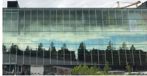
Gebouw INIT, waar Het Parool, De Volkskrant en Trouw zijn gevestigd.

Het Flevopark werd in 1928 aangelegd en kreeg in 1943 zijn naam. De naam is ontleend aan het Flevomeer, waaruit de Zuiderzee, tegenwoordig het IJsselmeer, is ontstaan. Aan de westzijde is een Joodse begraafplaats en in het park is ook een zwembad, het Flevoparkbad. Loop langs het Nieuwe Diep over de Zeeburgerdijk door het Funenpark naar eiland Oostenburg.