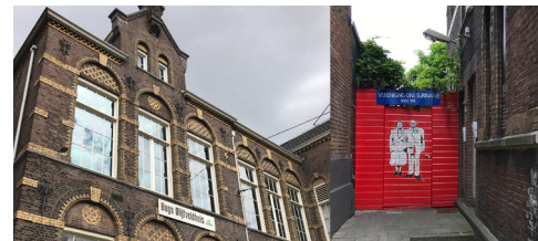
The Black Archives en VOS aan Zeeburgerdijk 19A&B.

Het VOC pakhuis 's Lands Zeemagazijn werd gebouwd in 1656. Er werden er kanonnen, zeilen, vlaggen en scheepsuitrusting voor de oorlogsvloot opgeslagen. Later werd het een pakhuis voor de marine totdat er in 1973 het Scheepvaartmuseum werd geopend met de op een na grootste maritieme collectie ter wereld. Loop via de Wittenburgergracht en Zeeburgerstraat naar de Zeeburgerdijk.