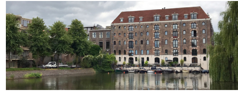
Locatie van scheepswerf De Eendracht, Kattenburgerkade/Bijltespad

Op een staander is de letter A en het VOC-logo (Verenigde Oostindische Compagnie) gebeiteld en de tekst: "Er ligt een roofstaat aan de zee, tussen Oost-Friesland en de Schelde" - Multatuli. Deze tekst is een onderdeel van de aanklacht, waarmee Multatuli z'n beroemde boek Max Havelaar eindigt. In dit boek klaagt hij de Nederlanden aan, dat ze 'Insulinde, het eilandrijk, dat zich slingert als een gordel van smaragd om de evenaar' uitbuit. De ondernemingsgeest en technische vaardigheid van de VOC staat naast de afschuw die we nu voelen voor de stuitende wreedheid van bijvoorbeeld Jan Pieterszoon Coen, die bijna alle 15.000 inwoners van Banda Eiland uitmoordde. Loop over de brug links naar de Kattenburgerkade.