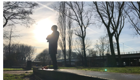
Martin Luther Kingpark, Amsterdam