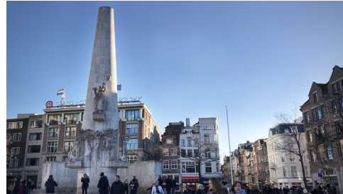
Nationaal Monument op de Dam van J.J.P. Oud (1956)

De Amsterdam Galerij is gratis te bezoeken. Het 40 meter lange tapijt van kunstenaar Barbara Broekman verbeeldt alle 179 nationaliteiten die in Amsterdam wonen. Amsterdam Museum brengt de geschiedenis van Amsterdam tot leven in al haar facetten. Daarom gebruiken ze de term 'Gouden Eeuw' niet meer om de 17e eeuw aan te duiden, omdat het niet de volledige realiteit van deze tijd weergeeft, zoals uitbuiting, armoede en slavernij. Ga terug naar de Sint Luciënsteeg en loop via de Nieuwezijds Voorburgwal en Paleisstraat naar de Dam. Hier start op 21 maart de jaarlijkse demonstratie op de Internationale Dag tegen Racisme en Discriminatie.