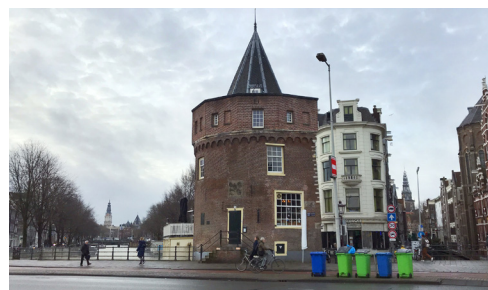
Prins Hendrikkade 94, Schreierstoren; links Zuiderkerk, rechts Oude Kerk

Elk jaar op de 3e zondag van januari worden de slachtoffers van Auschwitz herdacht bij het Spiegelmonument van Jan Wolkers: "De hemel blijft voorgoed geschonden. Het is een godsgruwelijke aanslag op alles waar een mens voor staat". Loop verder over de brug op de Anne Frankstraat naar het Oosterdok, langs de museumhaven, NEMO en over de Mr. J.J. van der Veldebrug langs de OBA (MLK-beeldje, boeken, toilet, horeca). Ga links over de Odebrug en rechtsaf de Prins Hendrikkade op.