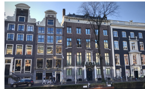
Herengracht 502, Huis met de kolommen, ambtswoning

Op 7 april 1968, drie dagen na de dood van Martin Luther King, werd er een stille tocht georganiseerd. Deze startte bij de Dokwerker. Dit beeld herinnert aan de Februaristaking op 25 februari 1941, tijdens de Tweede Wereldoorlog. Amsterdammers pikten het niet langer en gingen staken toen zelfs winkels en café's verboden gebied werden voor Joden. Deze staking wordt hier elk jaar herdacht. Loop via Nieuwe Herengracht en terug over Blauwbrug linksaf langs Amstel en over de brug rechts de Herengracht op, even zijde.