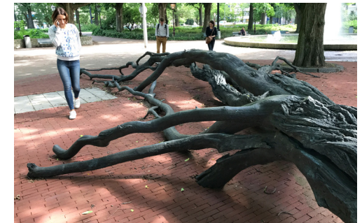
Frederiksplein, Monument Walraven van Hall door Fernando Sánchez Castillo (2010)

Willen van Loon (1537-1618) was een van de oprichters van de VOC (Verenigde Oost-Indische Compagnie) en in de 16e eeuw werden de drie morenkoppen toegevoegd aan het familiewapen. Nu is op Keizersgracht 672 Museum van Loon te bezoeken. In de hal hangt het huwelijksschilderij van Willem van Loon en Margaretha Bas (door Jan Miense, 1637). Er staat een zwarte man rechts op het schilderij, is hij ene bediende of een statussymbool? Ga linksaf naar de Vijzelstraat en weer links de Prinsengracht op en ga rechtsaf over de Utrechtsstraat naar het Frederiksplein.