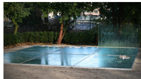
Wertheimpark, Spiegelmonument door Jan Wolkers (1977/1993)

Dit park werd vernoemd naar Martin Luther King, Jr. nadat hij was vermoord op 4 april 1968. Loop noordwaarts, ga over de Berlagebrug en loop verder langs de Amstel, ga over het water rechts de Nieuwe Keizersgracht op en via Plantage Parklaan naar het Wertheimpark.