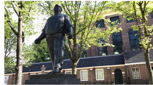
Jonas Daniël Meijerplein, De Dokwerker door Mari Andriessen (1952)