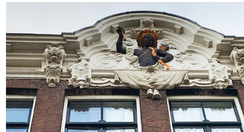
Rokin 64, gevel met de Moor (T-Mobile winkel).