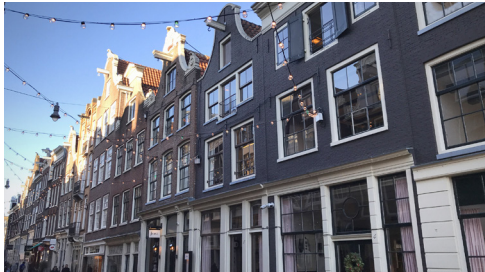
Reestraat 6, in de Negen Straatjes