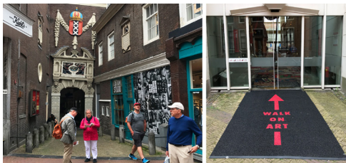
Sint Luciënsteeg, Amsterdam Galerij van het Amsterdam Museum

Surinaams anti-koloniaal schrijver en verzetsstrijder Anton de Kom woonde in 1935 op Reestraat 6. Hij schreef het beroemde boek 'Wij slaven van Suriname' (1934). Hij is een held in Suriname en in Nederland niet voldoende bekend. Om hem te eren staat er een standbeeld op het Anton de Komplein, opgenomen in Wandeling Zuidoost. Ga rechts Keizersgracht en links Wolfenstraat, Oude Spiegelstraat en Sint Luciënsteeg en dan rechts de naar het Amsterdam Museum.