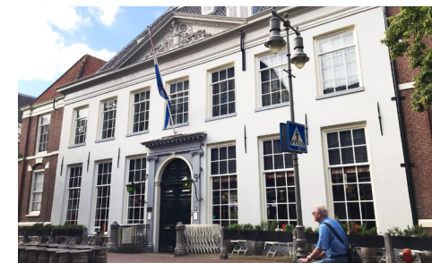
Herenmarkt 99, West-Indisch Huis, hoofdkantoor WIC 1623-1647

een strategisch uitkijkpunt dat zowel de Zuiderzee als de haven van Amsterdam overzag. Van hier vertrok in 1609 Henry Hudson, die in dienst van de VOC op zoek ging naar een Noordelijke doorgang en in de Hudson rivier terecht kwam. Er wordt gezegd dat de naam van de Schreierstoren komt van de vrouwen die hier huilden als ze hun man uitzwaaiden. Maar dat is zeer de vraag want vroeger heette het de Schrayershoucktoeren omdat de stadsmuur hier een scherpe hoek maakte (schray = scherp). Volg de Prins Hendrikkade voor (A) Amsterdam CS langs, bochtje naar links en dan rechts de Haarlemmerstraat op.