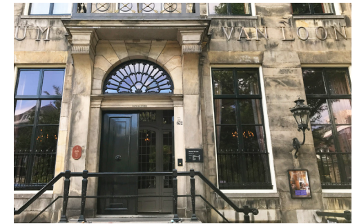
Keizersgracht 672, Museum Van Loon