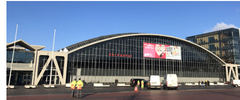
RAI evenementencentrum. Dominee King sprak in de Europahal.

De in 1948 vermoorde Indiase activist Mahatma Gandhi (1869-1948) was een grote inspiratiebron voor Martin Luther King. Hij zei: "Jezus gaf ons het doel en Gandhi gaf ons de tactiek". Gandhi leidde het geweldloze verzet voor onafhankelijkheid van India, wat op 15 augustus 1947 werd gerealiseerd. Wat King niet wist is dat Gandhi er ook racistische denkbeelden op nahield. Jaarlijks is er bij het beeld van Gandhi een herdenking van zijn geboortedag, op 2 oktober, de Internationale Dag van de Geweldloosheid. Loop verder en ga linksaf de Scheldestraat in tot aan (A) Europaplein, Metro 52/ (B) Station RAI.