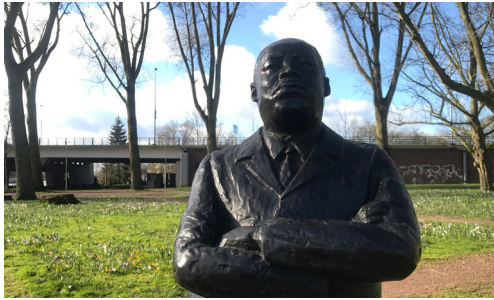
Martin Luther King Park, Amsterdam