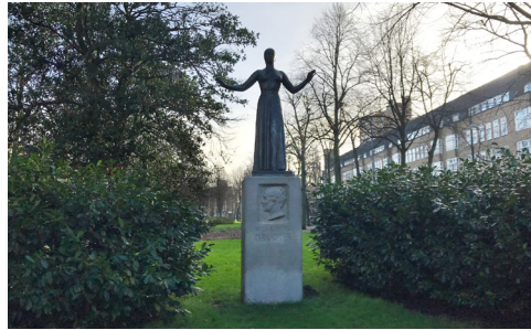
Churchillaan/Waalstraat. Standbeeld Wilhelmina Drucker door Gerrit-Jan van der Veen (1939)

Familie Frank met hun twee dochters Margot en Anne woonden op Merwedeplein 37-II totdat ze in 1942 moesten onderduiken voor de nazi's in het Achterhuis (Wandeling Centrum). Het beroemde roodgeruite dagboek kocht Anne om de hoek op Rooseveltlaan 62, waar nu nog steeds een boekhandel zit, Jimmink. In het trottoir voor huisnummer 37 liggen sinds 2015 vier struikelstenen, Stolpersteine van de Duitse kunstenaar Gunter Demnig, gedenktekens voor de woningen van gedeporteerden in WOII. In Amsterdam zijn 600 struikelstenen geplaatst, in Europa 75.000. Loop verder naar de Churchillaan.