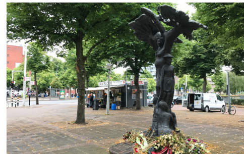
Surinameplein, Monument van Besef door Henry Renfurm (2003)

Op 16 augustus 1964 sprak dominee Martin Luther King in de RAI tijdens de Europese Baptisten conferentie. De preek werd op tv uitgezonden in Nederland, Duitsland, Zweden en Denemarken. Zie www.mlk50.nl > Videos & podcasts. Het Beatrixpark is voor een deel ontworpen door de eerste vrouwelijke stedenbouwkundige in Nederland Jakoba 'Ko' Mulder en werd geopend in 1938. Ze ontwierp ook het Amsterdamse Bos (Wandeling Zuidwest). Loop door het Beatrixpark, en verder west langs het Zuider Amstelkanaal, IJsbaanpad, dan noordwaarts langs de Westlandgracht, maak een lange lus door het Rembrandtpark en dan oostwaarts naar het Surinameplein.