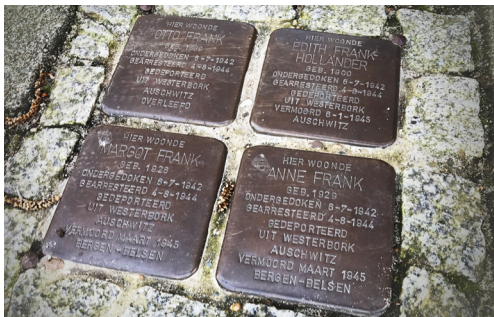
Merwedeplein 37-II: Stolpersteine voor de familie Frank, door Gunter Demnig (2015).