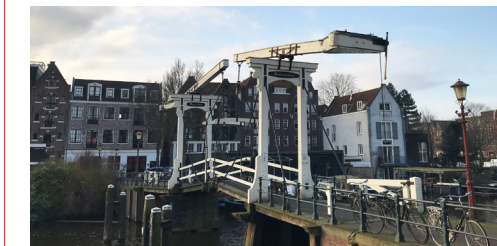
Drieharingenbrug, nr. 320 van de ruim 1900 bruggen in Amsterdam

Bevelhebbers van de West-Indische Compagnie (WIC) gaven in 1625 in het West-Indisch Huis opdracht tot de bouw van een fort op het eiland Manhattan, het latere New York. De slavenhandel vormde de omvangrijkste scheepvaartactiviteit van de WIC. In de periode 1674-1740 heeft de compagnie 383 schepen uitgereed en meer dan 550.000 tot slaaf gemaakte Afrikanen verhandeld. Ga rechts de Buiten Oranjestraat in, loop verder over de Grote Bickerstraat, links Realengracht en weer links.