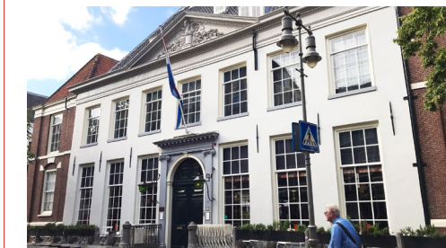
Herenmarkt 99, West-Indisch Huis, hoofdkantoor WIC 1623-1647

Deze verdedigingsstoren dateert uit 1487 en was onderdeel van de stadsmuur van Amsterdam, de eerste verdedigingswerken die vanaf 1481 werden aangelegd. Het was een strategisch uitkijkpunt dat zowel de Zuiderzee als de haven van Amsterdam verzag. Van hier vertrok in 1609 Henry Hudson, die in dienst van de VOC op zoek ging naar een Noordelijke doorgang en in de Hudson rivier terecht kwam. Er wordt gezegd dat de naam van de Schreierstoren komt van de vrouwen die hier huilden als ze hun man uitzwaaiden. Maar dat is zeer de vraag want vroeger heette het de Schrayershouckstoren omdat de stadsmuur hier een scherpe hoek maakte (schray = scherp). Volg de Prins Hendrikkade voor (A) Amsterdam CS langs, bochtje naar links en dan rechts de Haarlemmerstraat op.