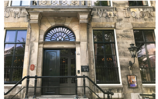
Keizersgracht 672, Museum Van Loon