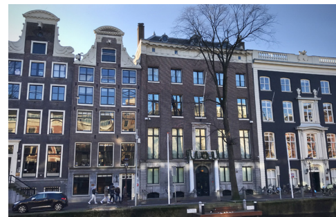
Herengracht 502, Huis met de kolommen, ambtswoning