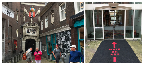
Kalverstraat 92, Amsterdam Galerij van het Amsterdam Museum