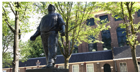
Jonas Daniël Meijerplein, De Dokwerker door Mari Andriessen (1952)

Dit park werd vernoemd naar Martin Luther King, Jr. nadat hij was vermoord op 4 april 1968. Loop noordwaarts, ga over de Berlagebrug en loop verder langs de Amstel, ga over het water rechts de Nieuwe Keizersgracht op, en linksaf langs het Weesperplantsoen, waar het Holocaustmonument wordt gerealiseerd. Volg de Weesperstraat tot het Jonas Daniël Meijerplein.