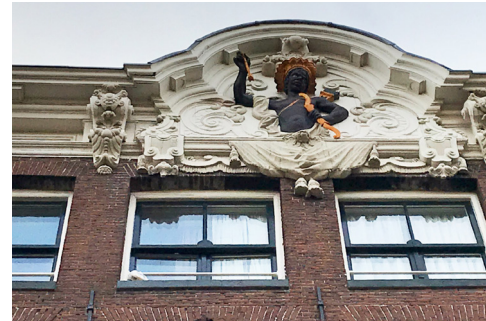
Rokin 64, gevel met de Moor (T-Mobile winkel).

De Amsterdam Galerij is gratis te bezoeken. Het 40 meter lange tapijt van kunstenaar Barbara Broekman verbeeldt alle 179 nationaliteiten die in Amsterdam wonen. Amsterdam Museum brengt de geschiedenis van Amsterdam tot leven in al haar facetten. Daarom gebruiken ze de term 'Gouden Eeuw' niet meer om de 17e eeuw aan te duiden, omdat het niet de volledige realiteit van deze tijd weergeeft, zoals uitbuiting, armoede en slavernij. Loop naar de Kalverstraat en ga links en dan rechts door de Duifjessteeg en rechts het Rokin op tot nummer 64.