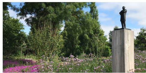
Martin Luther Kingpark, Amsterdam