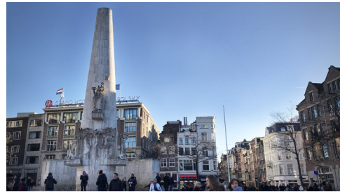
Nationaal Monument op de Dam van J.J.P. Oud (1956)

Surinaams anti-koloniaal schrijver en verzetsstrijder Anton de Kom woonde in 1935 op Reestraat 6. Hij schreef het beroemde boek 'Wij slaven van Suriname' (1934). Hij is een held in Suriname en in Nederland niet voldoende bekend. Om hem te eren staat er een standbeeld op het Anton de Komplein, opgenomen in Wandeling Zuidoost. Loop verder over de Paleisstraat naar de Dam.