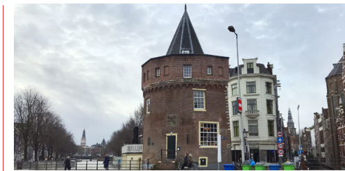
Prins Hendrikkade 94, Schreierstoren; links Zuiderkerk, rechts Oude Kerk

Elk jaar op de 3e zondag van januari worden de slachtoffers van Auschwitz herdacht bij het Spiegelmonument van Jan Wolkers: "De hemel blijft voorgoed geschonden. Het is een godsgroewelijke aanslag op alles waar een mens voor staat". Loop verder over de brug op de Anne Frankstraat naar het Oosterdok, langs de museumhaven, NEMO en over de Mr. J.J. van der Veldebrug langs de OBA (MLK-beeldje, boeken, toilet, horeca). Ga links over de Odebrug en rechtsaf de Prins Hendrikkade op.