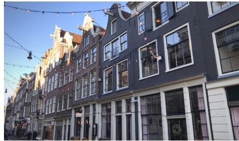
Reestraat 6, in de Negen Straatjes

een betekenisvolle plek om na te denken over diversiteit en inclusiviteit. Loop linksaf de Prinsengracht op en rechts naar de Reestraat.