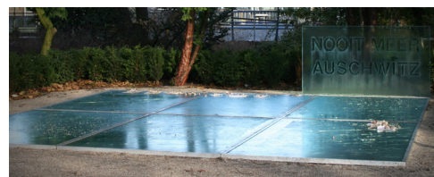
Wertheimpark, Spiegelmonument door Jan Wolkers (1977/1993)

Op 7 april 1968, drie dagen na de dood van Martin Luther King, werd er een stille tocht georganiseerd. Deze startte bij de Dokwerker. Dit beeld herinnert aan de Februaristaking op 25 februari 1941, tijdens WOII. Amsterdammers pikten het niet langer en gingen staken toen zelfs winkels en café's verboden gebied werden voor Joden. Deze staking wordt hier elk jaar herdacht. Loop langs de Nieuwe Herengracht en ga de brug over naar het Wertheimpark.