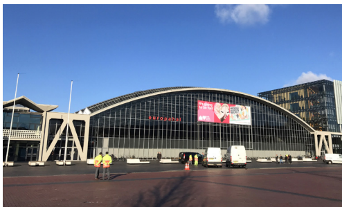
RAI evenementencentrum. Dominee King sprak in de Europahal.

Loop westwaarts via (A) Europaplein / (B) Station RAI langs de RAI door het Beatrixpark.