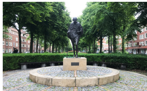
Churchillaan, Gandhi monument door Karel Gomes (1990)

In het Concertgebouw kreeg Martin Luther King op 20 oktober 1965 het eredoctoraat in Sociale Wetenschappen uitgereikt door de Vrije Universiteit Amsterdam (VU, zie Wandeling Zuidwest). Zie Polygoonjournaal op Videos & podcasts. Bezoek evt. het Rijksmuseum of loop verder Zuidwaarts langs de Boerenwetering en Amstelkanaal naar de Churchillaan.