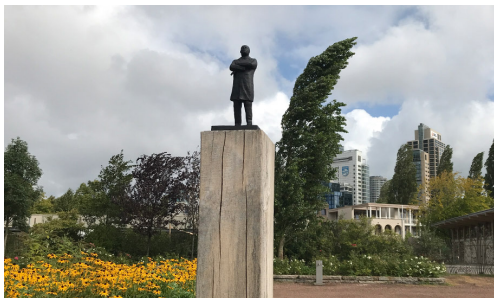
Martin Luther King Park, Amsterdam